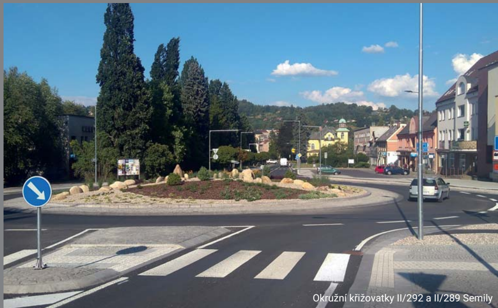
Okružní křižovatky II/292 a II/289 Semily