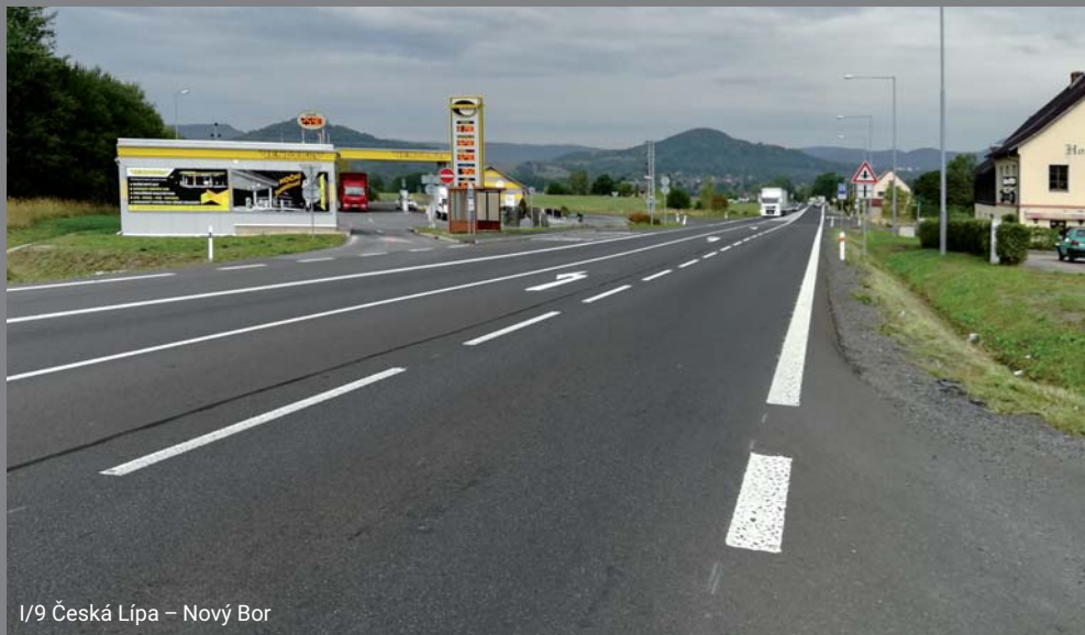
I/9 Česká Lípa – Nový Bor

v nejbližším období, vývoj dopravní nehodovosti, plánování a financování rekonstrukcí silnic nižších tříd a silniční infrastruktura z regionálního pohledu.