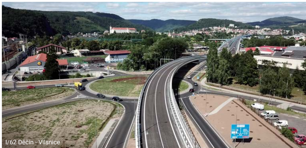
I/62 Děčín - Vilsnice

elastomerová za současného zdvihnutí NK, reinjektace kabelových kanálků a ošetření kotevnicích oblastí. Jsou vybudovány nové úložné prahy, závěrné zídky, křídla, přečhodové desky, spřahující deska, izolace, jsou zřízeny nové římsy, zádržný systém a vozovkové souvrství.