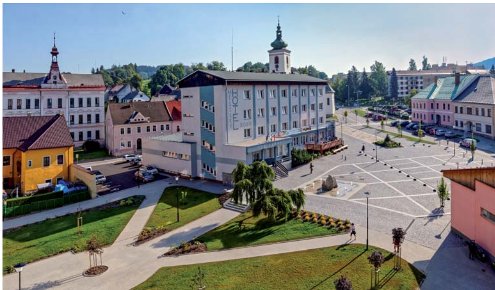
Rekonstrukce náměstí ve Volarech