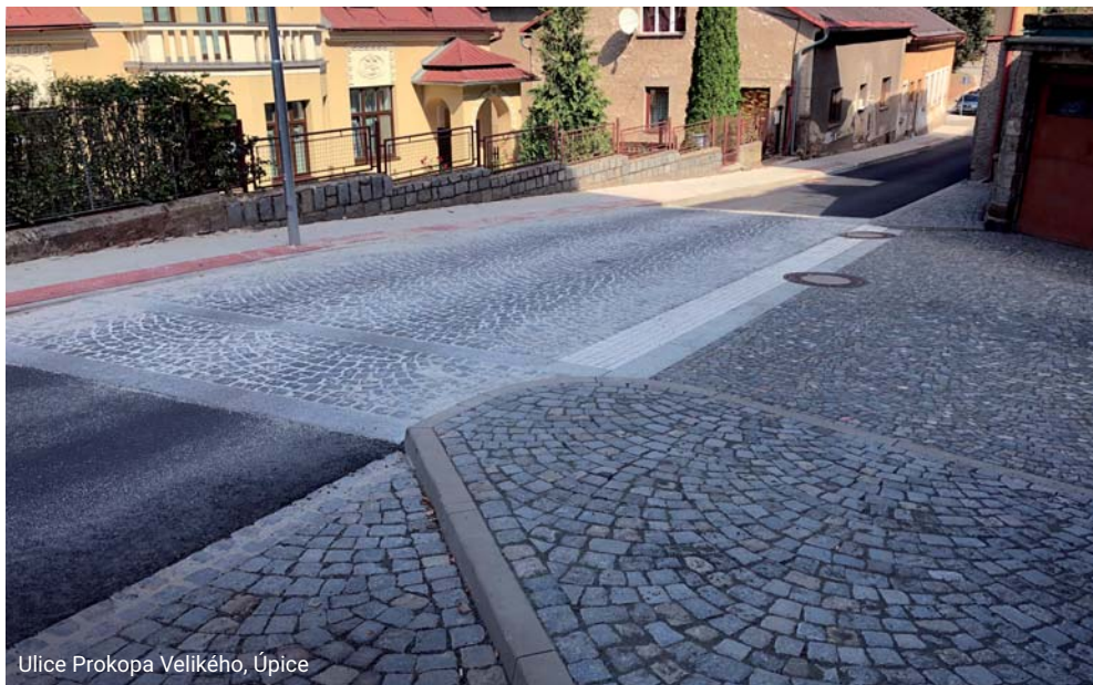
Ulice Prokopa Velikého, Úpice